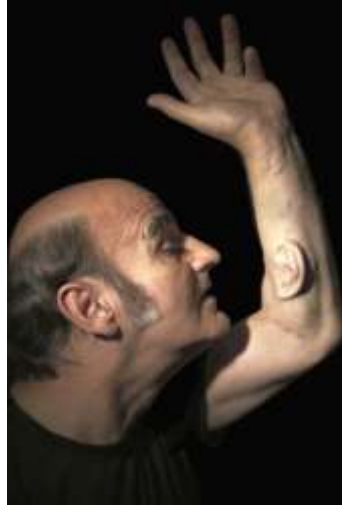
الصورة عدد ٤