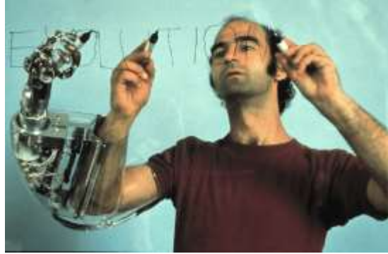
صورة عدد ١ Stelarc اليد الثالثة the third hand 1980-1998

إن فكرة الوجود الطوبولوجي للجسد تتيح تصور هذا الجسد كشيء غير ثابت، بل قابل للانفتاح والتشويه بشكل مستمر، ويعني أن الجسد ليس كائنًا مغلقًا بل هو دائمًا في حالة تفاعل مع المحيط الرقمي. يوفر لنا الفن الرقمي، والذي يعمل على دمج الحركة والتفاعل مع الواقع الافتراضي، مناحًا مثاليًا لإنتاج تجسيدات غير ثابتة، وتصورات جسدية تتغير باستمرار. تلك الأعمال التي تعيد تشكيل الجسد على نحو غير ثابت، على سبيل المثال جسديًا ونفسيًا، هي انعكاس لهذه الطوبولوجيا الجديدة التي يعاد تحديد الجسد من خلالها. في هذا السياق، يمكننا رؤية أعمال مثل عمل الفنان Stelarc اليد الثالثة (the third hand) (صورة عدد ١) حيث قام Stelarc في هذا العمل بزراعة ذراع صناعية آلية إضافية على جسده، تتحرك عبر إشارات كهربائية تتحكم بها حركة عضلاته. هذا المشروع يمثل تجاوزًا لمفهوم الجسد البشري العضوي عبر إضافة أطراف ميكانيكية تتحكم فيها إشارات بيولوجية.