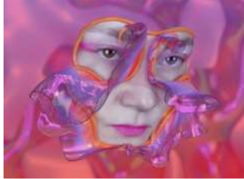
الصورة عدد ٥

في سياق الفن المعاصر، لا يتم تقديم الهوية والجسد كتمثيلات جاهزة أو ثابتة، بل يتم تفكيكهما وإعادة تشكيلهما باستمرار باستخدام التقنيات الرقمية 10 . فنانون الميديا الجديدة مثل Hito Steyerl و Ines Alpha و Zach Blas يقدمون نماذج مثيرة للاهتمام حول كيفية إعادة رسم الجسد والهوية في العصر الرقمي. تقدم Ines Alpha في مشروعها "Face Filter Studio" (صورة عدد ٥) وجه الإنسان كمساحة قابلة للتحويل باستخدام فلاتر رقمية. في هذا المشروع، الوجه ليس مجرد مرآة للداخل أو تمثيلاً للذات، بل سطح قابل للتعديل، يمكن للمستخدمين إعادة تصميمه ليعكس هويات متعددة أو هويات مؤقتة تتشكل وتختفي بحسب السياق الرقمي. هذا يعكس فكرة الهوية كأداء مستمر، في سياق ديناميكي حيث الذات تتغير بناءً على التفاعلات الرقمية.