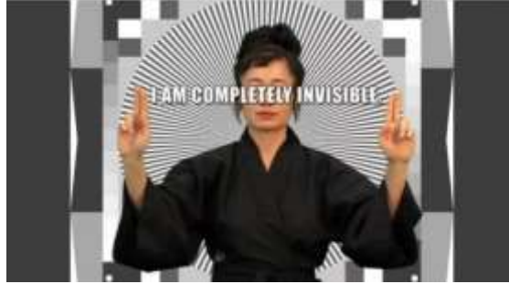
الصورة عدد ٧

تكنولوجيا التعرف على الوجوه. هذا يُظهر كيف أن الهوية الرقمية لا تقتصر على كونها سمة فردية، بل هي ساحة سياسية حيث يُعاد النضال من أجل الخصوصية والأصالة 11 . أيضا في أعمال الفنانة والباحثة الألمانية Hito Steyerl، نجد تجسيدا حادًا لفكرة الجسد والهوية كمساحات طوبولوجية غير ثابتة، تنتقل بين الواقع، الصورة، المحاكاة، والأرشيف الرقمي. من أبرز أعمالها في هذا السياق: (2013) "How Not to Be Seen" (الصورة عدد ٧).