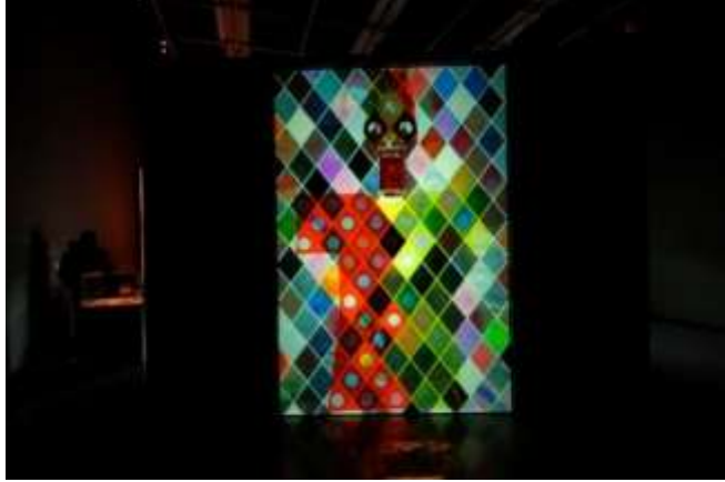
صورة عدد ٢

جمع عينات من الحمض النووي من أجناس بشرية مختلفة، وابتكار "معطف أو جلد" بيولوجي افتراضي مكون من هذه الجينات، لتمثيل الجسد كمزيج هجين ثقافي وبيولوجي، هنا نتحدث عن استخدام البيولوجيا الرقمية لزعة مفاهيم "النقاء" و"الهوية الأصلية".