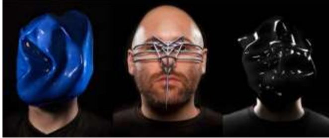
الصورة عدد ٦

أما في العمل "Facial Weaponization Suite" - Zach Blas، فيتم تحويل الوجوه إلى نماذج يصعب التعرف عليها باستخدام تقنيات التعرف الآلي (الصورة عدد ٦).